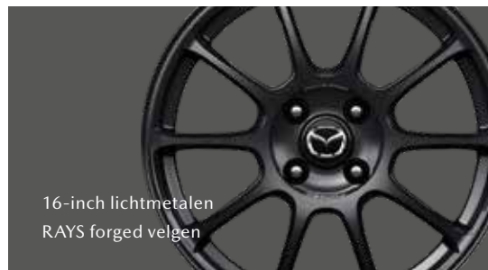
16-inch lichtmetalen RAYS forged velgen