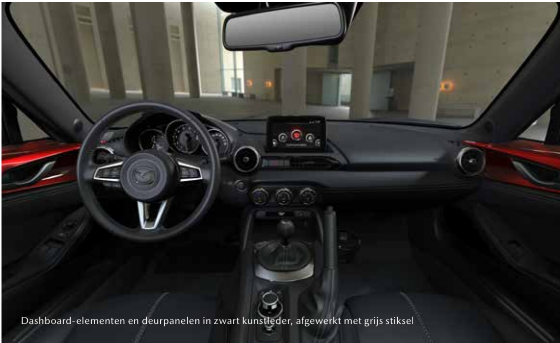
Dashboard-elementen en deurpanelen in zwart kunstleder, afgewerkt met grijs stiksel