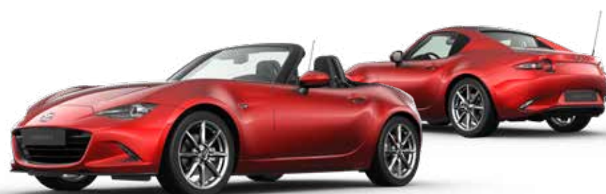
SOUL RED CRYSTAL METALLIC**