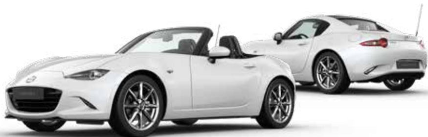
ARCTIC WHITE SOLID