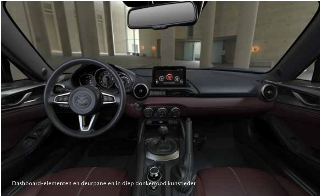
Dashboard-elementen en deurpanelen in diep donkerrood kunstleder