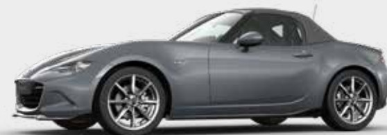
Mazda MX-5 Roadster met Sport pakket