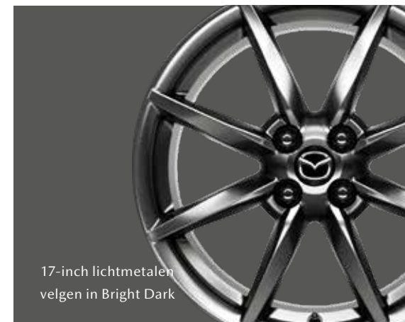
17-inch lichtmetalen velgen in Bright Dark