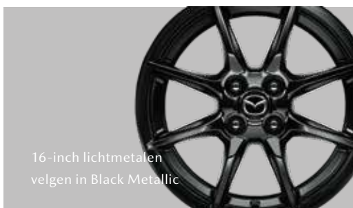
16-inch lichtmetalen velgen in Black Metallic