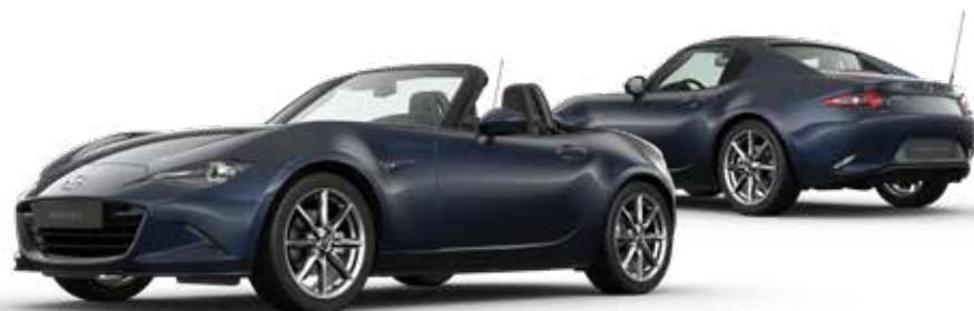
DEEP CRYSTAL BLUE MICA