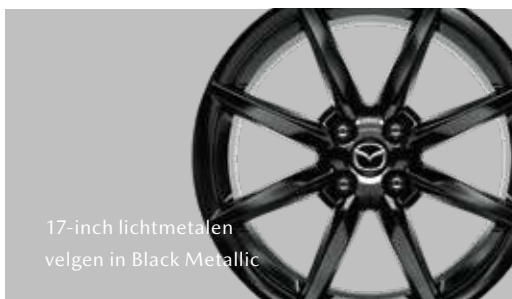
17-inch lichtmetalen velgen in Black Metallic