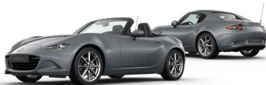
POLYMETAL GRAY METALLIC