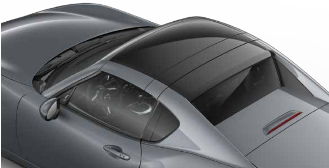
Mazda MX-5 RF Sportive in Polymetal Gray met Twin Tone dak