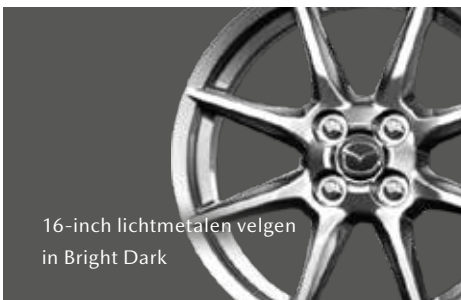
16-inch lichtmetalen velgen in Bright Dark