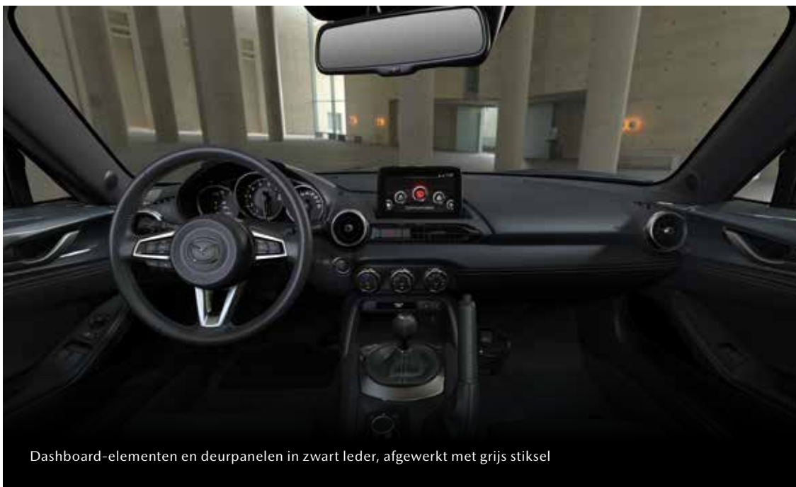
Dashboard-elementen en deurpanelen in zwart leder, afgewerkt met grijs stiksel