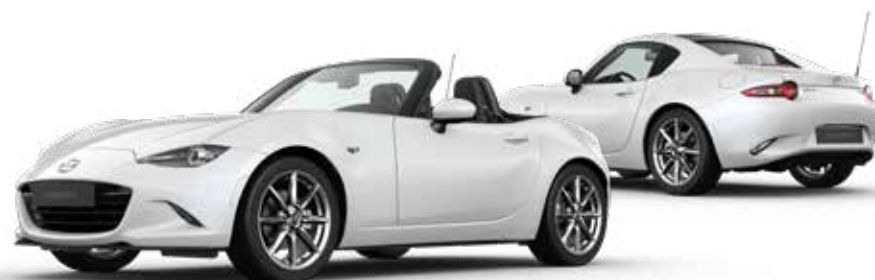
SNOWFLAKE WHITE PEARL