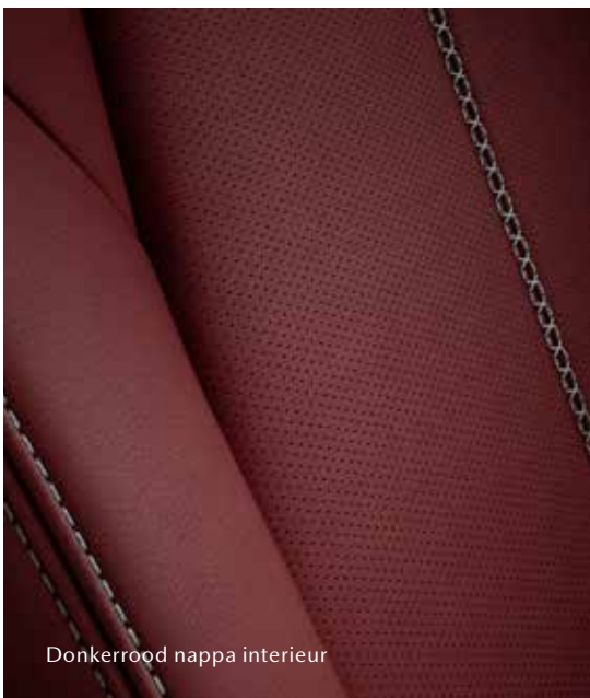
Donkerrood nappa interieur