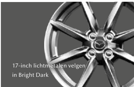
17-inch lichtmetalen velgen in Bright Dark