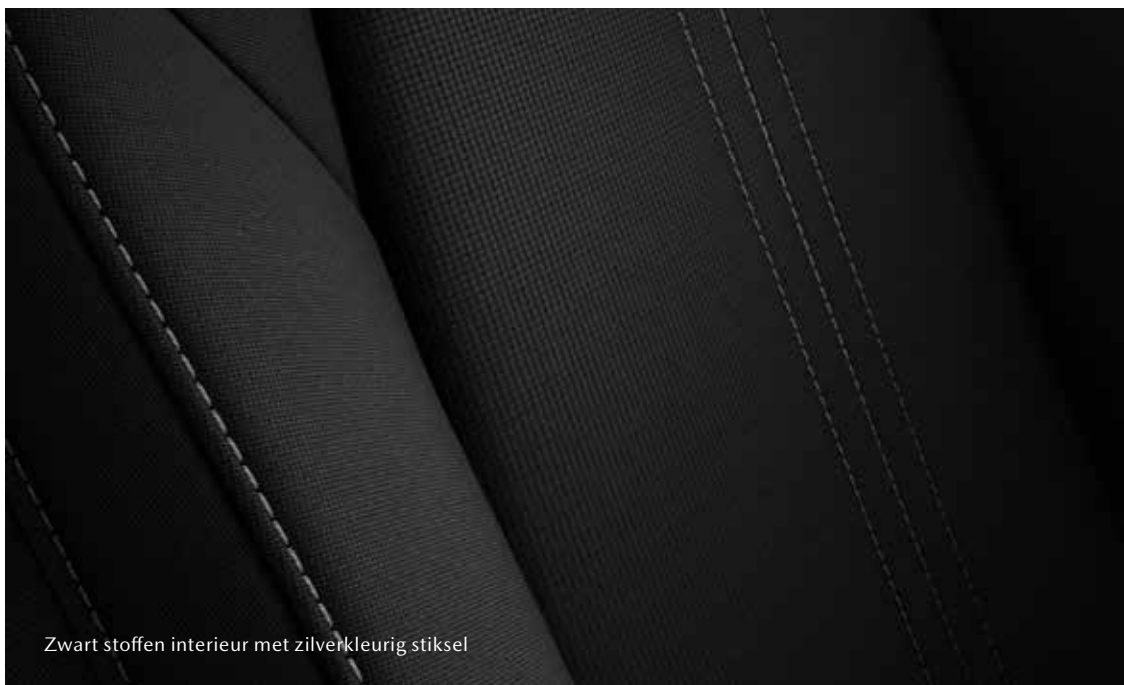
Zwart stoffen interieur met zilverkleurig stiksel