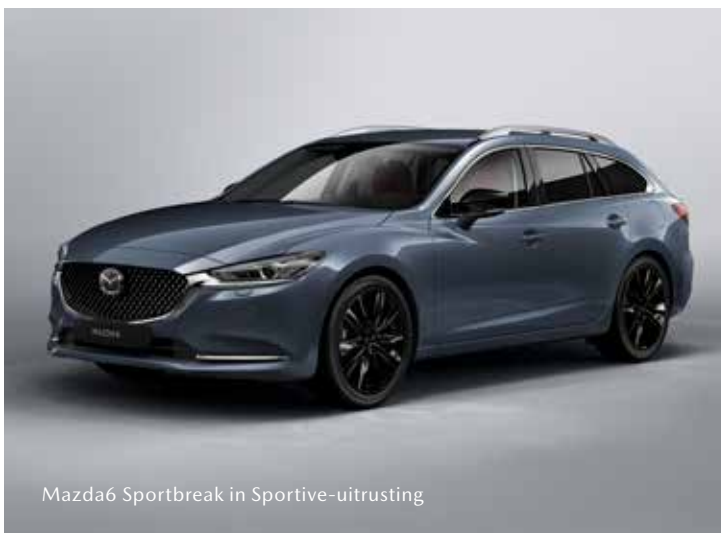
Mazda6 Sportbreak in Sportive-uitrusting