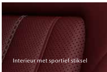
Interieur met sportief stiksel