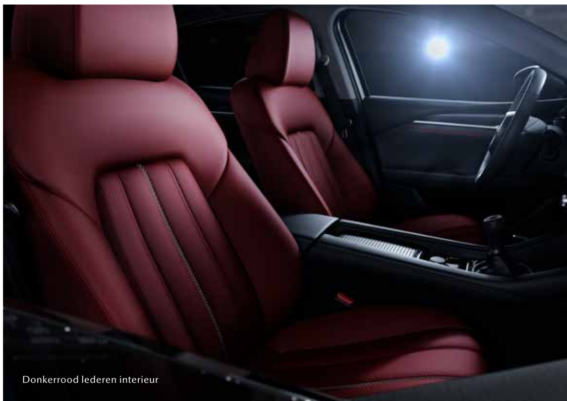
Donkerrood lederen interieur