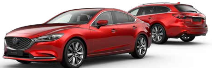
SOUL RED CRYSTAL METALLIC € 1.250