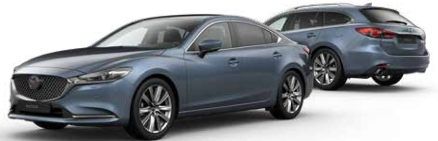
BLUE REFLEX MICA € 900