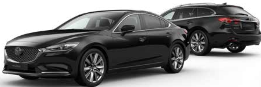
JET BLACK MICA

Je hebt de keuze uit tien kleuren. Arctic White Solid vormt de basis. Machine Gray Metallic en Soul Red Crystal Metallic zijn het meest exclusief. Een speciale laktechniek met nog kleinere en heldere aluminiumdeeltjes zorgt voor een ongekend diepe, heldere kleur.