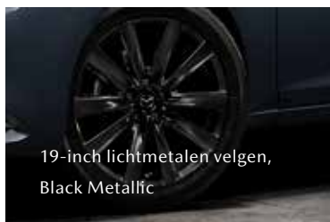
19-inch lichtmetalen velgen, Black Metallic