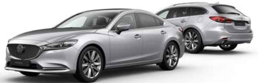
SONIC SILVER METALLIC € 900