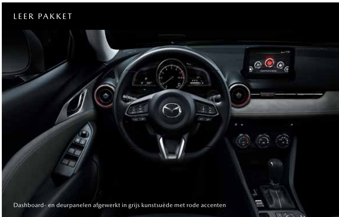
Dashboard- en deurpanelen afgewerkt in grijs kunstsuède met rode accenten