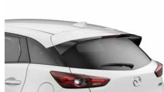
Dakspoiler Uitgevoerd in Brilliant Black.