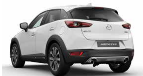
Skidplate t.b.v. achterzijde Uitgevoerd in zilverkleur.