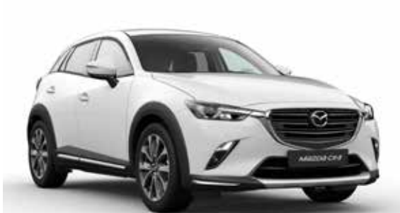
Skidplate t.b.v. voorzijde Uitgevoerd in zilverkleur.