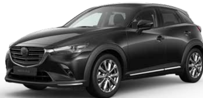
JET BLACK MICA