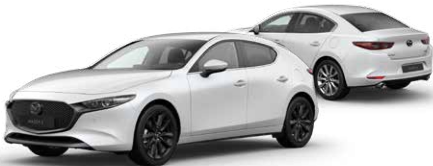
SNOWFLAKE WHITE PEARL € 800