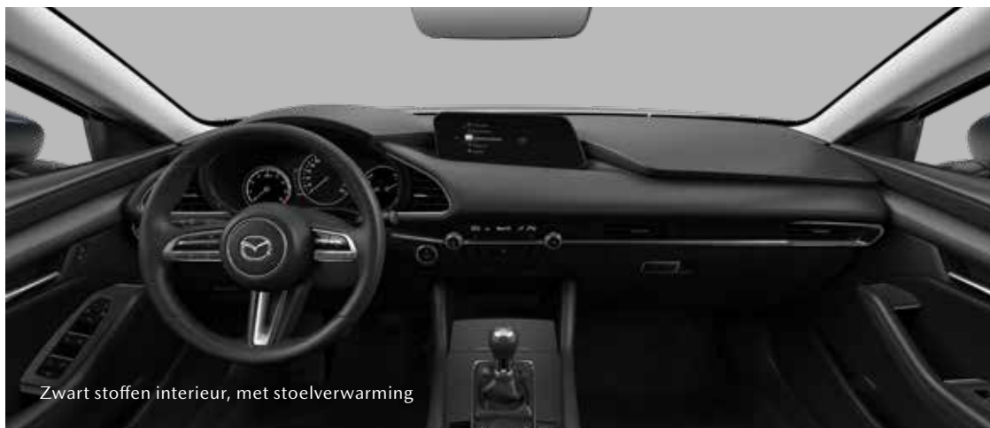
Zwart stoffen interieur, met stoelverwarming

Hecht je waarde aan sportiviteit? Kies dan voor de Mazda3 Sportive met alle luxe van de Comfort-uitvoering in combinatie met de krachtiger e-Skyactiv G benzinemotor met 150 pk, 18-inch lichtmetalen wielen, LED signature verlichting en onderscheidende exterieurdetails. Ook te combineren met het aantrekkelijke Sport pakket voor een extra imponerende uitstraling.