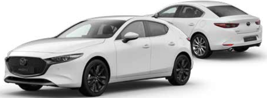
ARCTIC WHITE SOLID