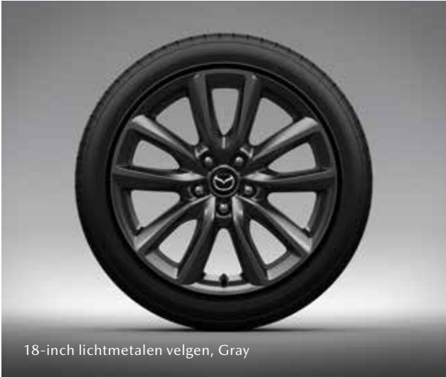
18-inch lichtmetalen velgen, Gray