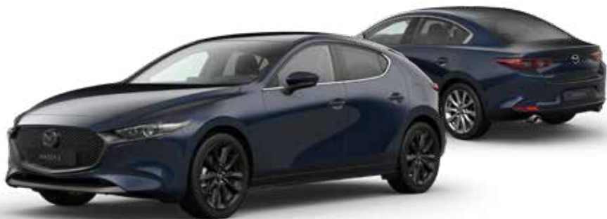
DEEP CRYSTAL BLUE MICA € 800