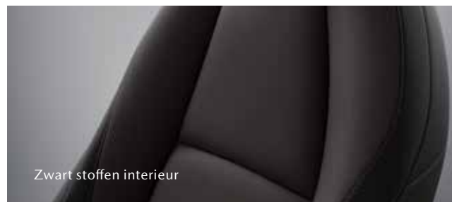
Zwart stoffen interieur