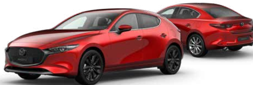
SOUL RED CRYSTAL METALLIC € 1.150