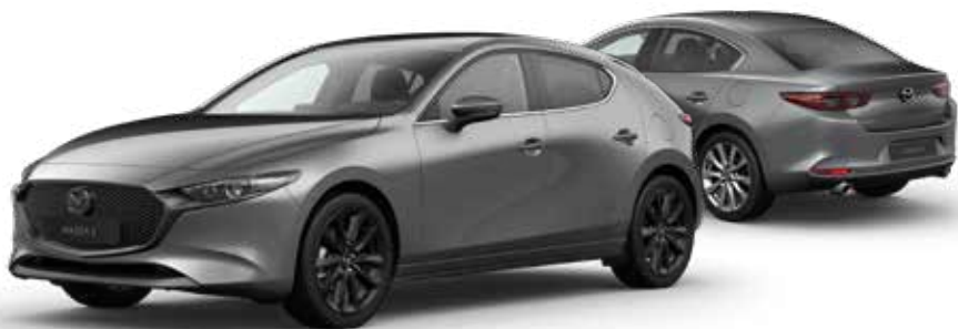
MACHINE GRAY METALLIC € 1.000