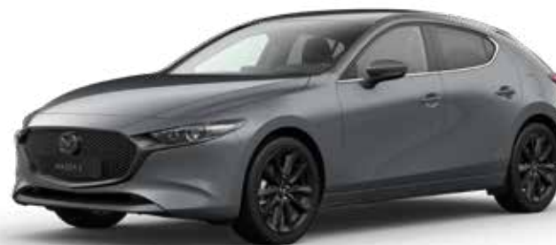
POLYMETAL GRAY METALLIC (enkel beschikbaar op Hatchback) € 800