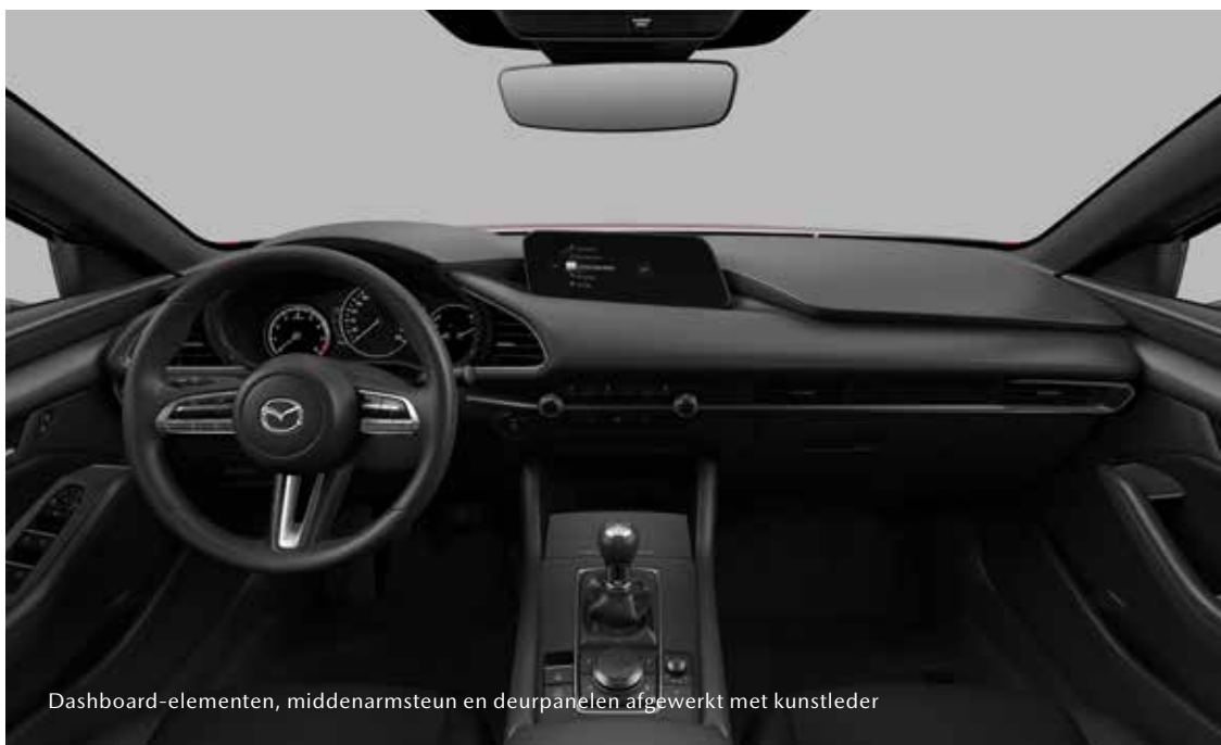
Dashboard-elementen, middenarmsteun en deurpanelen afgewerkt met kunstleder