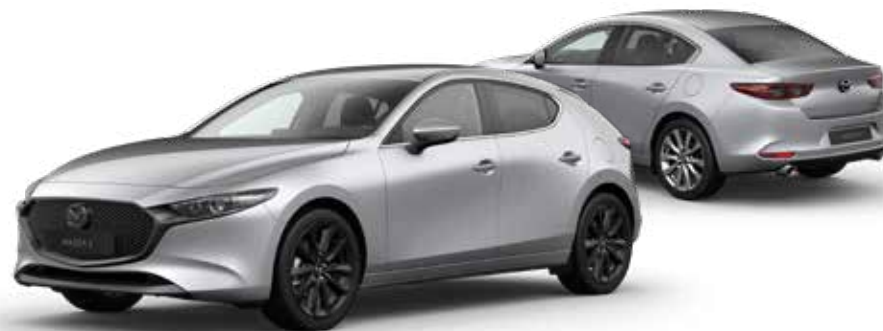
SONIC SILVER METALLIC € 800