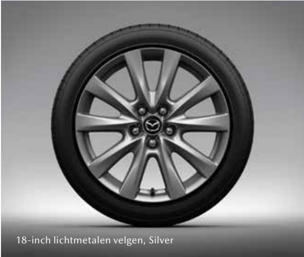
18-inch lichtmetalen velgen, Silver