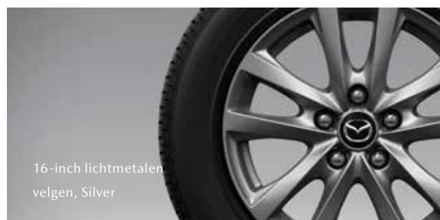
16-inch lichtmetalen velgen, Silver