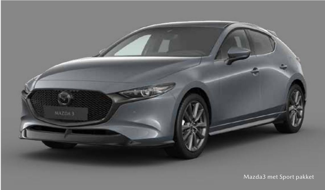
Mazda3 met Sport pakket