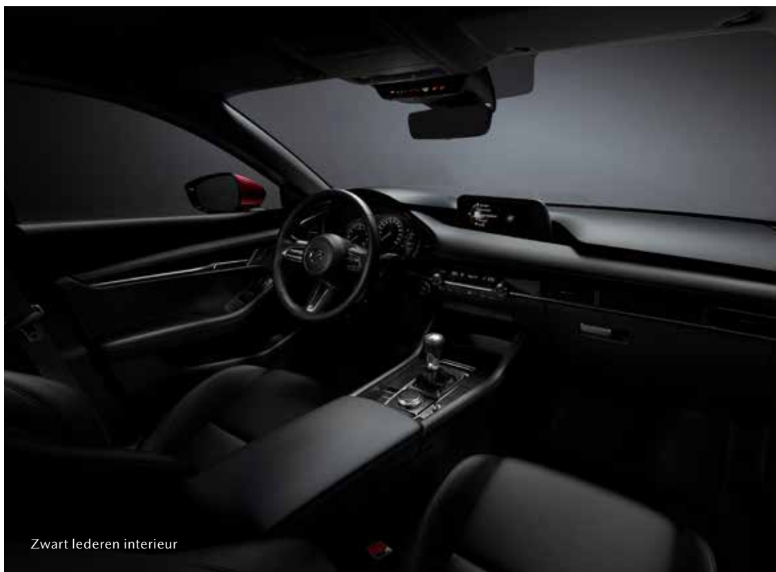
Zwart lederen interieur