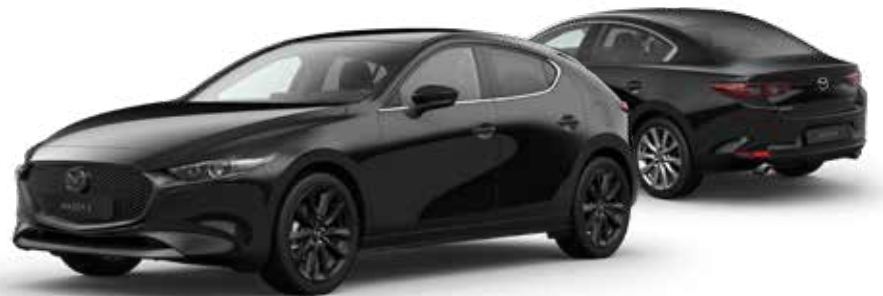
JET BLACK MICA