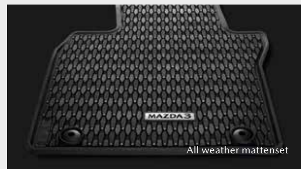
All weather mattenset