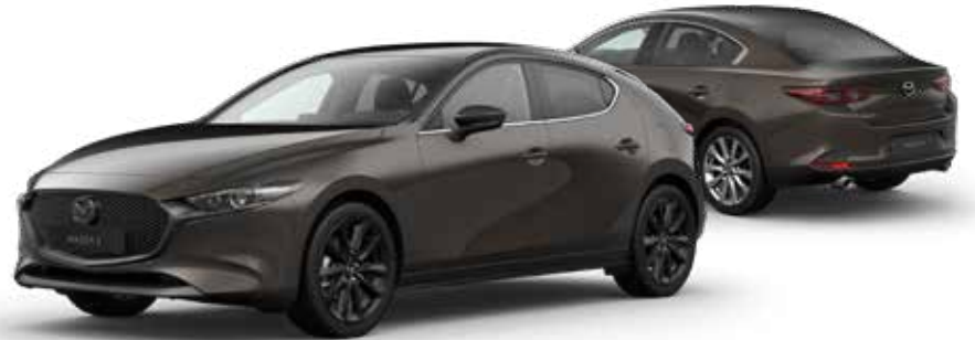
TITANIUM FLASH MICA