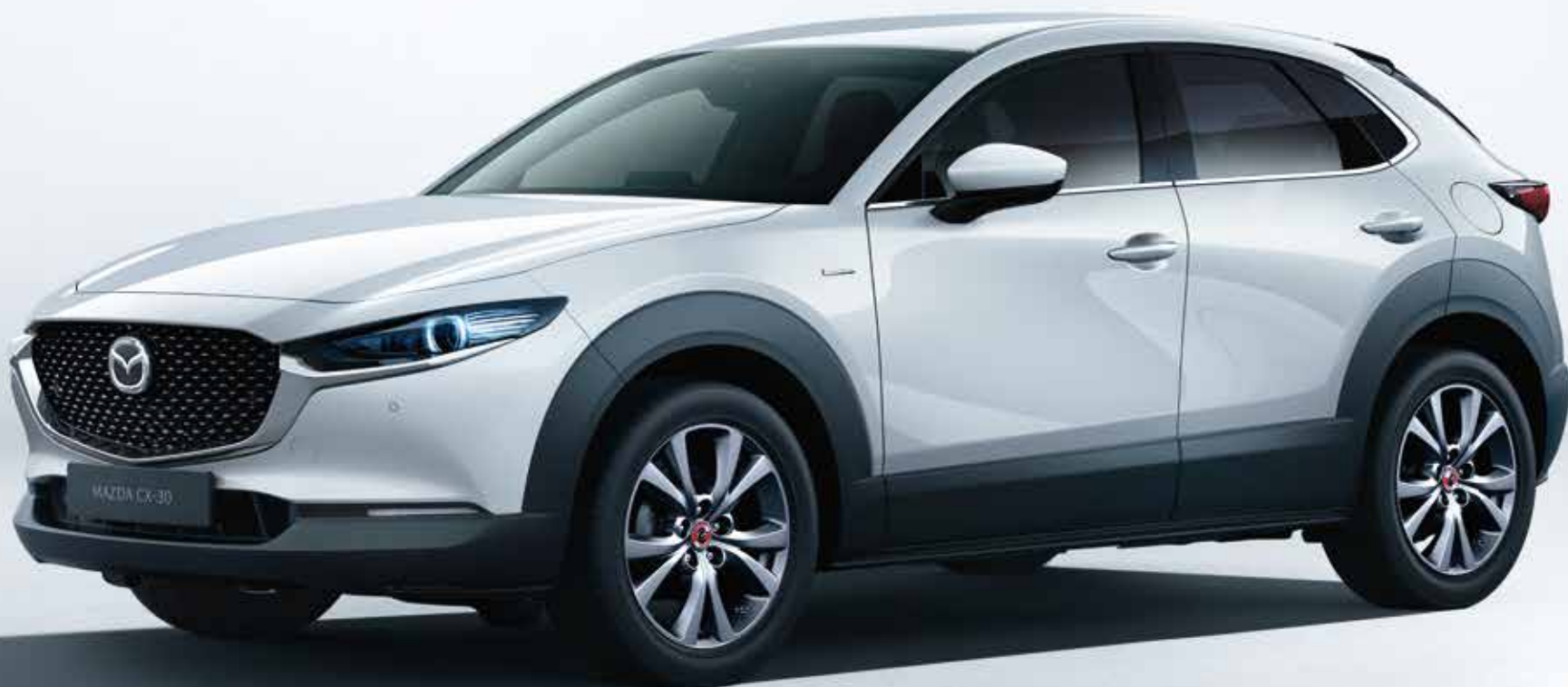
Foto: Mazda CX-30 als 100th anniversary edition in Snowflake White Pearl.