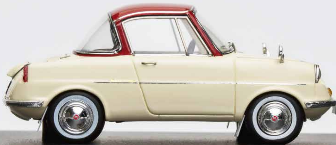
Foto: Mazda R360 Coupé-schaalmodel.